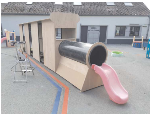
Petit train en cours de fabrication

Bonne nouvelle pour nos petites têtes blondes ! Le petit train si caractéristique de l'Ecole Notre-Dame est de retour dans la cour.